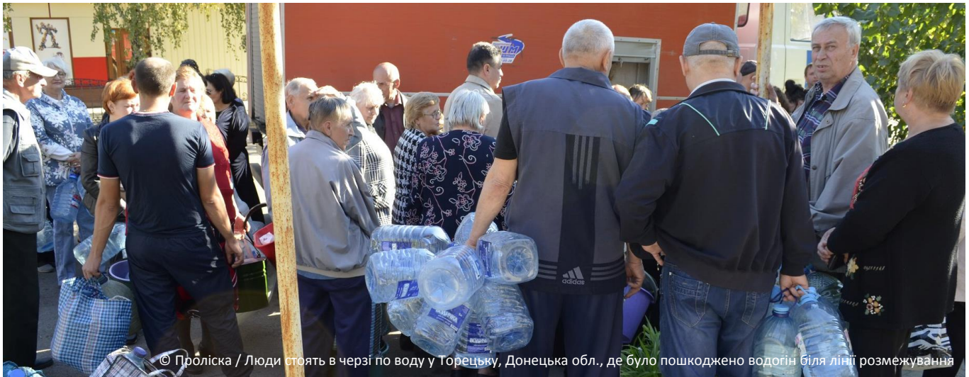
Люди стоять в черзі по воду у Торезьку, Донецька обл., де було пошкоджено водогін біля лінії розмежування

КЛАСТЕР З ПИТАНЬ ЗАХИСТУ ВКЛЮЧЕ СУБКЛАСТЕРИ ІЗ ЗАХИСТУ ДІТЕЙ, ГЕНДЕРНОЗУМОВЛЕНОГО НАСИЛЬСТВА ТА ПРОТИМІННОЇ ДІЯЛЬНОСТІ